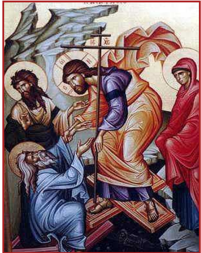
TABLE OF CONTENT - CUPRINSUL REVISTEI